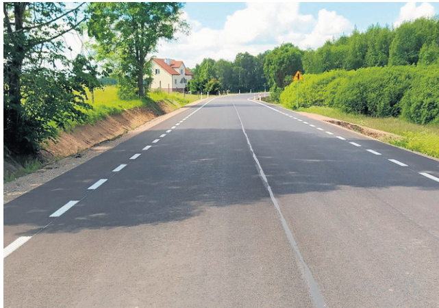
Droga powiatowa Gryszańce - Żegary - Dusznica. Inwestycja obejmowała odcinek o długości 3 km. Całkowity koszt tego zadania wyniósł ponad 2,47 mln zł i w całości został sfinansowany z Rządowego Funduszu Inwestycji Lokalnych. W ramach przebudowy wykonano m.in. nową nawierzchnię, asfaltowe pobocza dla ruchu rowerowego, przebudowano zjazdy.