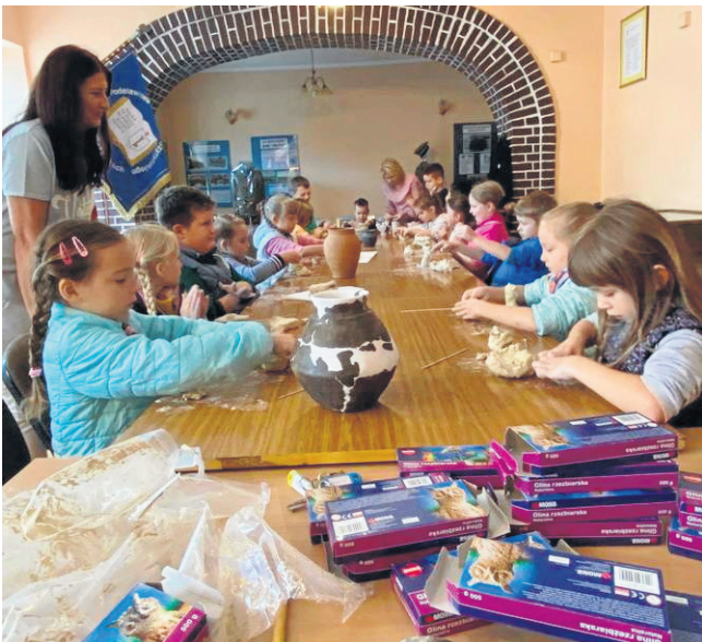
Wrzesień 2021 r. Zajęcia z gliny, dofinansowane przez powiat, prowadzone w klasach I-III w Szkole Podstawowej w Sejnach.