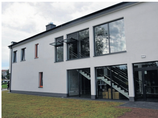
Nowy budynek ma dwie kondygnacje i ponad 400 m kw. powierzchni użytkowej.

Zarząd powiatu sejneńskiego zdecydował, by powierzyć prowadzenie Środowiskowego Domu Samopomocy w Sejnach Regionalnemu Stowarzyszeniu na rzecz Osób Niepełnosprawnych w Sejnach. Stowarzyszenie będzie prowadzić placówkę do końca sierpnia 2027 roku.