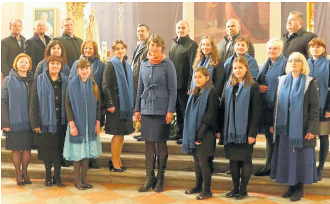
Chór Ziemi Sejneńskiej. Jego działalność jest dofinansowywana przez powiat sejneński już od kilku lat.