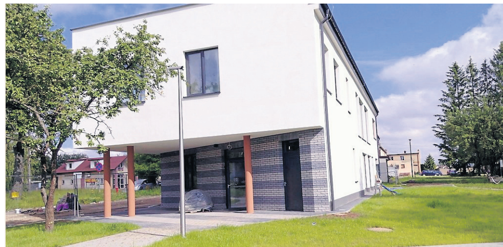
Środowiskowy Dom Samopomocy funkcjonuje w nowo wybudowanym budynku przy ulicy Łąkowej w Sejnach.