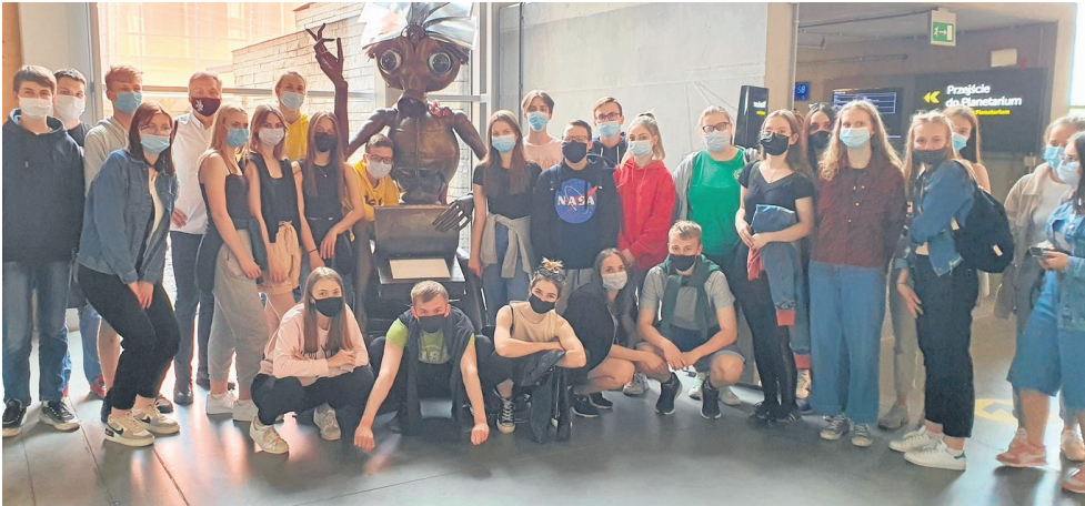
Młodzież nie tylko uczestniczyła w dodatkowych zajęciach, ale i wzięła udział w dwóch wyjazdach edukacyjnych.

Projekt realizowany był przez Liceum Ogólnokształcące im. Szymona Konarskiego w Sejnach oraz Liceum Ogólnokształcące z Litewskim Językiem Nauczania im. 11 Marca w Puńsku w 2020 roku.