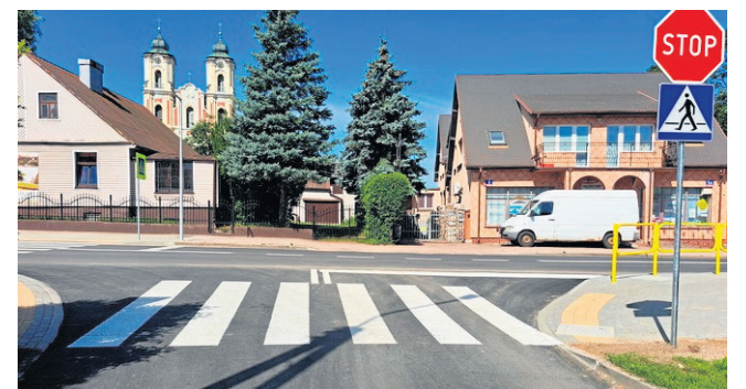
W 2022 roku na terenie miasta Sejny oraz gminy Giby, Puńsk i Krasnopol zostało wyremontowanych łącznie dziesięć przejść dla pieszych.