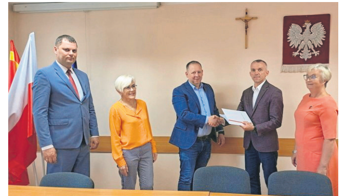
Lipiec 2022 r. Podpisanie umowy z wykonawcą na przebudowę 3 km drogi Krasnopol - Żłobin - Jeziorki.

Budowa Powiatowego Centrum Sportu czy Środowiskowego Domu Samopomocy to ogromne przedsięwzięcia, które dzięki determinacji władz lokalnych, pracy samorządowców, wsparciu parlamentarzystów, przestały być tylko wizją. Ostatnie lata to także rozwój infrastruktury drogowej, inwestycje w zdrowie, edukację. Samorządowcy nie boją się ciężkiej pracy i mają mnóstwo pomysłów, by polepszać codzienne życie mieszkańców.