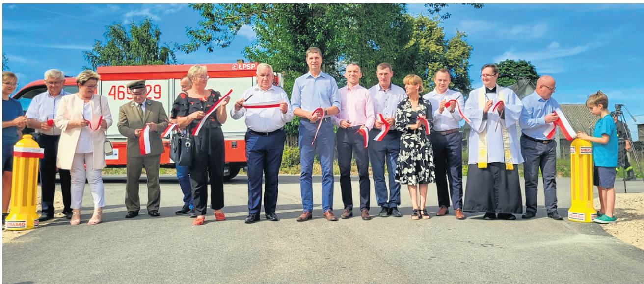
Nie zabrakło tradycyjnego przecięcia wstęgi, któremu towarzyszyli znamienici goście, m.in. Dariusz Piontkowski, wiceminister edukacji czy poseł Kazimierz Gwiazdowski, a także samorządowcy.

To było wielkie wydarzenie dla mieszkańców Zelwy w powiecie sejneńskim. Na nowe nawierzchnie czekali tam kilkadziesiąt lat. Teraz mogą jeździć bezpiecznymi i komfortowymi gminnymi i powiatowymi drogami. Mają także nową świetlicę, w której będą mogli się spotykać i integrować.