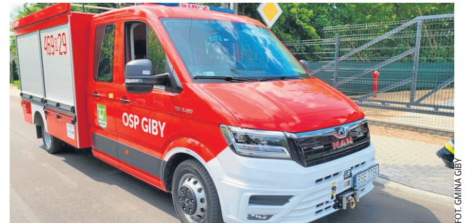
Już w kwietniu tego roku w ramach projektu strażacy zakupili nowy wóz bojowy.

Dzięki wsparciu Komendanta Wojewódzkiego PSP w remizie pojawił się też nowy quad. Maszyna będzie służyć druhom w dotarciu do zdarzeń w trudno dostępnych miejscach, do pożarów lasów itp., ale też do holowania łódki, której nabycie jest zaplanowane.