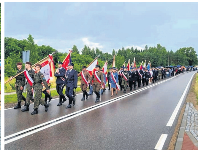
Uroczystości rocznicy Obławy Augustowskiej to wielkie święto w gminie Giby. Tradycyjnie, w trzecią niedzielę lipca, obchodzono 77. rocznicę pomordowanych bohaterów.