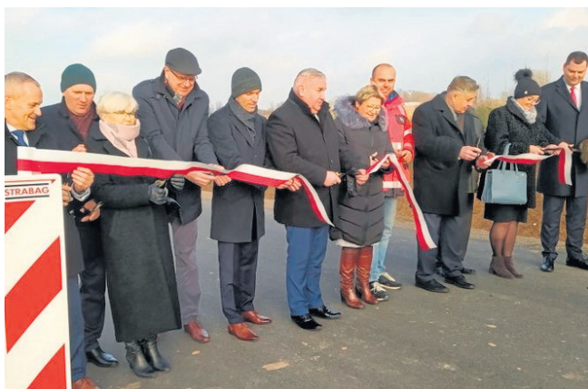
Droga Wiatrołuża - Wysoka - Góra - Remieńkiń. Przebudowano odcinek o długości 1,129 km w miejscowości Wysoka Góra. Wartość inwestycji wyniosła ponad 570 tys. zł, z czego 96 proc. stanowiło dofinansowanie z Rządowego Funduszu Rozwoju Dróg, z Urzędu Marszałkowskiego Województwa Podlaskiego oraz gminy Krasnopol.