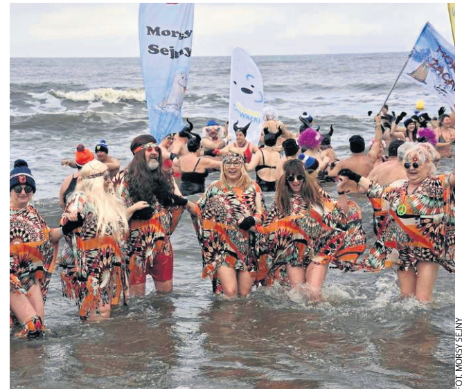
Luty 2022. Morsy Sejny w Mielnie. Wyróżnieni zostali w konkursie na najoryginalniejszy Klub Hipisowskiej Parady Morsów.