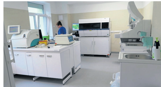
Laboratorium zostało powiększone o ponad 34 m kw., a personel zyskał dostęp do pomieszczeń przez wewnętrzne przejście.