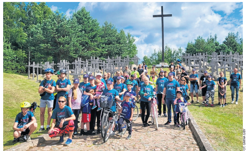
Rajd Rowerowy Śladami Ofiar Obławy Augustowskiej odbył się w sobotę, 16 lipca tego roku. Wzięło w nim udział ponad 60 osób.