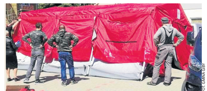
Szybko rozkładalny namiot NSR z wyposażeniem to również zakup, dzięki wsparciu z programu Interreg. Kosztował prawie 75 tys. zł, z czego 90 proc. stanowiła dotacja.