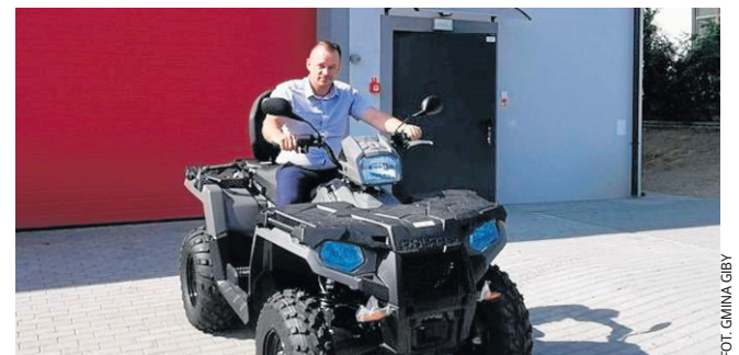
Quad, który również trafił do OSP Giby, będzie służyć druhom w dotarciu do zdarzeń w trudno dostępnych miejscach.