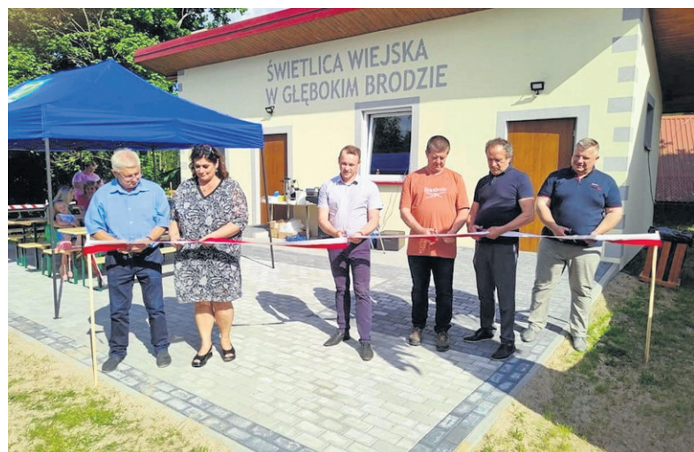
Obiekt będzie służył mieszkańcom Głębokiego Brodu, Frącek, Tartaczyska, Sarnetek, Okółka, Dworczyńska oraz innych okolicznych sołectw.