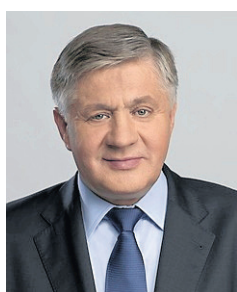
Krzysztof Jurgiel, Poseł do Parlamentu Europejskiego

W 2006 roku Sejm przyjął ustawę o zasadach prowadzenia polityki rozwoju kraju, w której określono zespół wzajemnie powiązanych działań, podejmowanych i realizowanych w celu zapewnienia trwałego i zrównoważonego rozwoju kraju, spójności społeczno-gospodarczej, regionalnej i przestrzennej, podnoszenia konkurencyjności gospodarki oraz tworzenia nowych miejsc pracy.