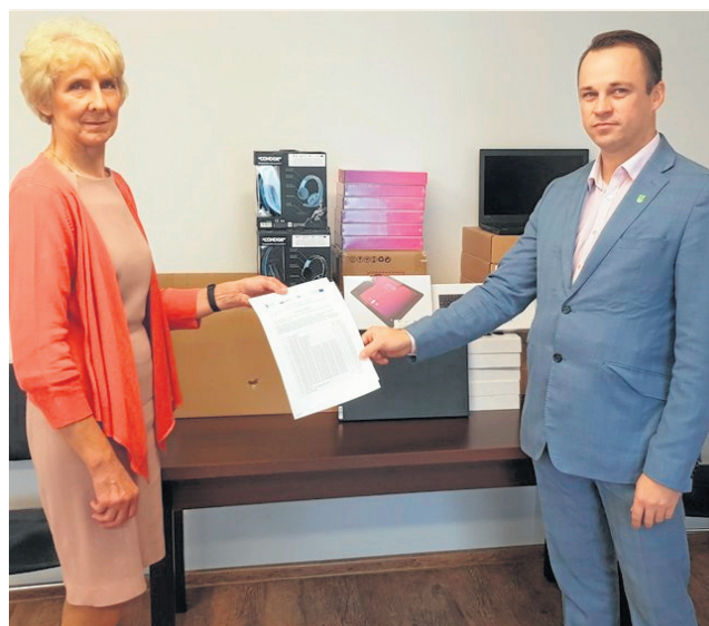
W ramach programu Zdalna Szkoła gmina pozyskała 60 nowych urządzeń, zaś przeprowadzona reforma oświaty pozwoliła na ograniczenie wydatków publicznych o 1,5 mln zł.