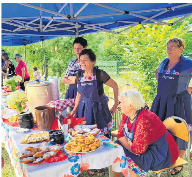
Na pikniku było wiele atrakcji. Zgromadzonym czas umilała muzyka na żywo, a także poczęstunek, który przygotowały Panie z Koła Gospodyń Wiejskich z Pogorzela oraz Koła Gospodyń Wiejskich z Zelwy.

Już zawiązało się przy niej nowe koło gospodyń wiejskich. Świetlica kosztowała 250 tysięcy złotych. Tu także znaczący wkład mieli mieszkańcy, bo zdecydowaną większość prac remontowych wykonała właśnie oni.