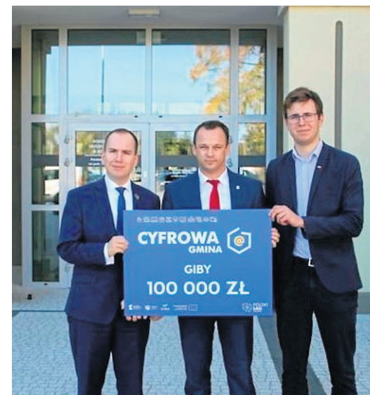
Dzięki pozyskanym pieniądzą z Ministerstwa Cyfryzacji, bez wkładu własnego, gmina Giby będzie miała nową serwerownię i sprzęt komputerowy.