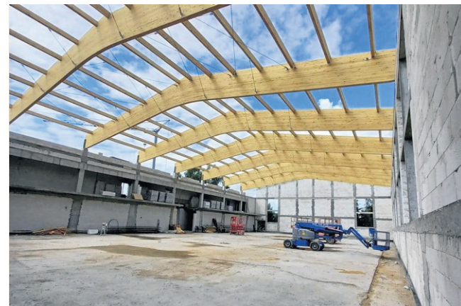
Hala sportowa w trakcie budowy. Na zdjęciu widok od środka, gdzie mieścić się będą m.in. boiska do gier zespołowych.

S tarostwo zapowiada, że z infrastruktury będzie mogła korzystać młodzież z lokalnych szkół, klubów sportowych, jak również mieszkańcy z terenu całego powiatu sejneńskiego. Wartość obiektu to ponad 10 mln zł.