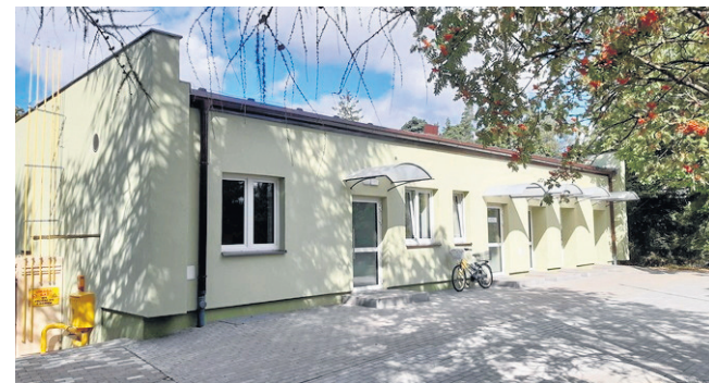
Dzięki dofinansowaniu w szpitalu przebudowano i wyremontowano pralnię na punkt pralniczy.

828.432,28 zł. Dofinansowanie stanowiło 85 proc. i pozyskano je z programu Interreg V-A. Placówka podjęła się także współpracy dla wysokiej jakości transgranicznej opieki zdrowotnej i mobilności pacjentów pogranicza. Dzięki temu zostanie zakupiony sprzęt medyczny, m.in. gastrofibroskop, kolumna endoskopowa, kardiokograf.