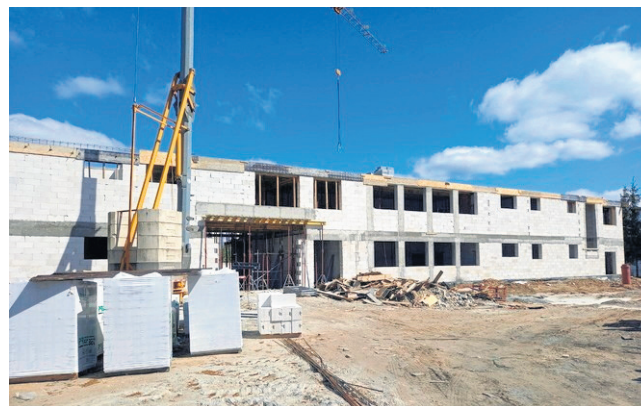
To będzie największa na Sejneńszczyźnie pełnowymiarowa hala sportowa.

Projekt obejmuje również zagospodarowanie terenu wokół hali oraz wykonanie parkingów. Powstaną 17 miejsc dla samochodów, oświetlenie terenu. Powiat sejneński otrzymał na ten cel ponad 332 tys. zł dofinansowania. W ramach przedsięwzięcia powstaną także siłownia zewnętrzna. Wszystkie prace mają zakończyć się jesienią 2023 roku.