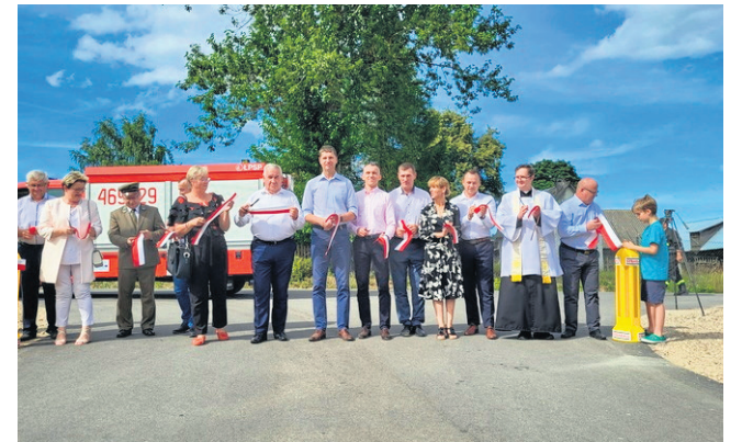
Sierpień 2022 r. Otwarcie drogi w Zelwie. Dofinansowanie z rządu, Gminy Giby, Nadleśnictwa Pomorze.