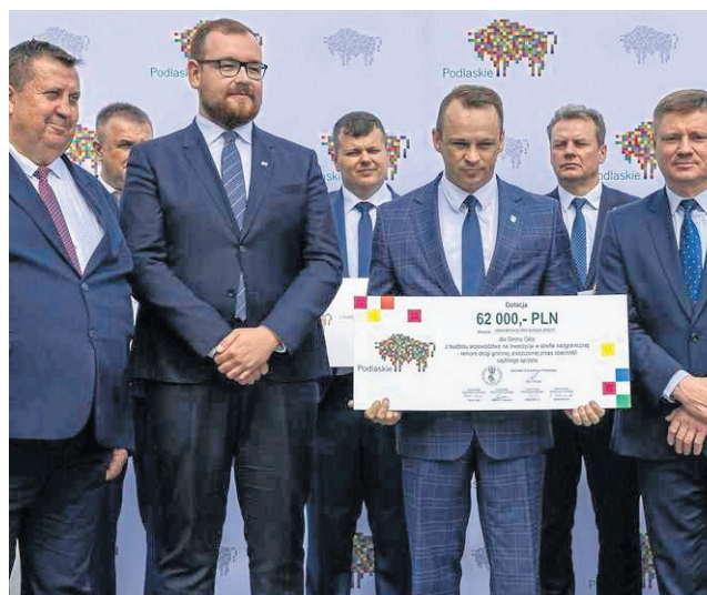
62 tys. zł - tyle trafi do gminy Giby dofinansowania na remonty dróg wyeksploatowanych podczas kryzysu migracyjnego na granicy polsko-białoruskiej.