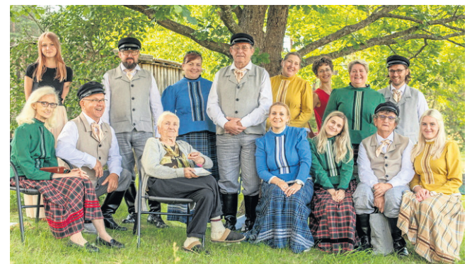
Zespół Nachodne z Ośrodka Kultury w Sejnach otrzymał dofinansowanie z powiatu w 2020 r. W 2021 r. zespół zajął II miejsce w kategorii „Zespół śpiewaczy” na 55. Ogólnopolskim Festiwalu Kapel i Śpiewaków Ludowych w Kazimierzu Dolnym.