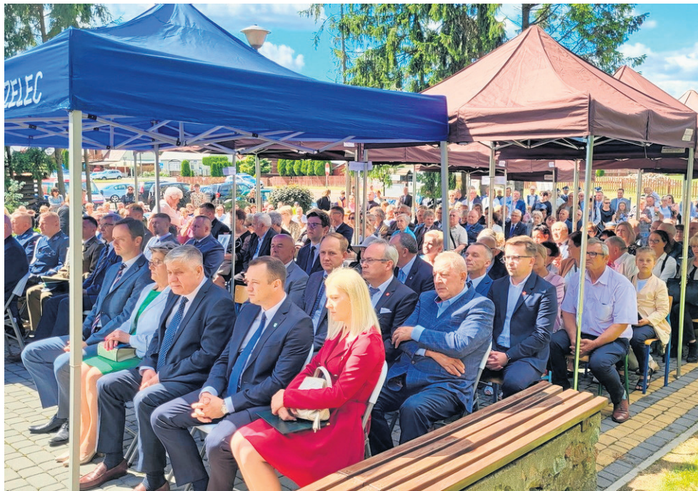
Na tej ważnej uroczystości zgromadzili się nie tylko mieszkańcy, ale i licznie przybyli samorządowcy, posłowie, przedstawiciele wojewody, Urzędu Marszałkowskiego.

Polscy patrioci byli brutalnie przesłuchiwanymi i bici, a po wielu ślad zaginął. Znane są nazwiska prawie 600 ofiar Obławy Augustowskiej. Historycy twierdzą, że może być ich znacznie więcej, nawet dwa tysiące. Do dziś nie wiadomo, gdzie dokładnie zostali zamordowani i gdzie spoczywają ich szczątki.