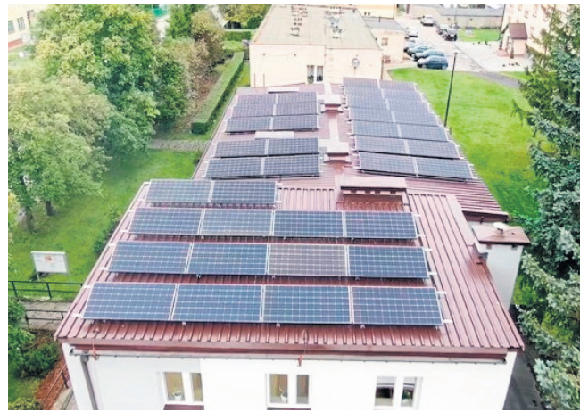
Odnawialne źródła energii pojawiły się także na dachu Powiatowego Urzędu Pracy.

o mocy 15,91 kW, Liceum Ogólnokształcące z Litewskim Językiem Nauczania im. 11 Marca w Puńsku - instalację o mocy 25,90 kW, zaś Starostwo