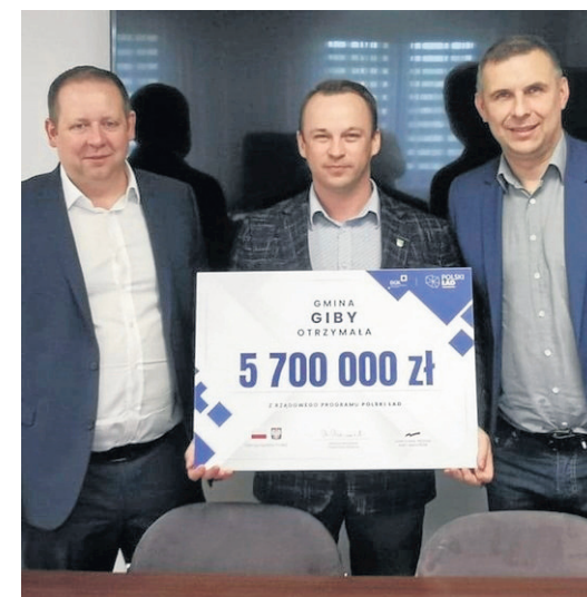
Gmina Giby z Polskiego Łądu otrzymała 5,7 mln złotych, dzięki czemu przybędzie kilka kilometrów dróg, w tym 4 km ścieżki pieszo-rowerowej.