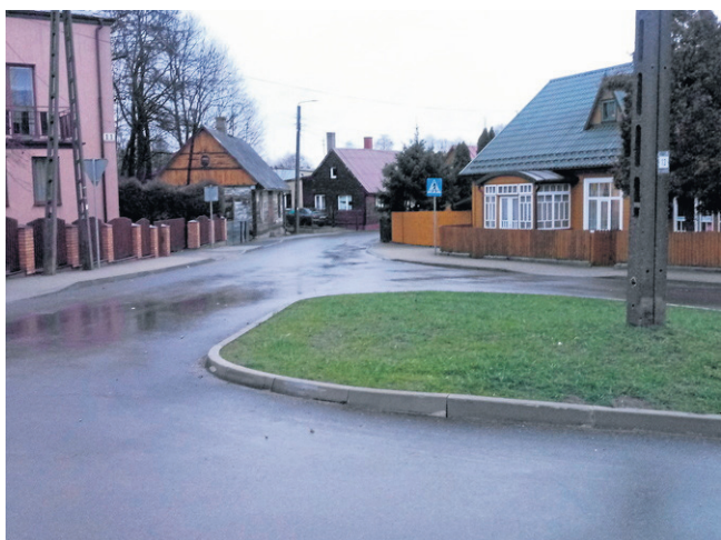
Ulica Ogrodowa w Sejnach. Wyremontowano odcinek 114 m od ul. Strażackiej do skrzyżowania z ul. Słowackiego. Inwestycja pochłonęła 161 226,87 zł, z czego aż 95 proc. stanowiło dofinansowanie z Urzędu Marszałkowskiego Województwa Podlaskiego oraz miasta Sejny.