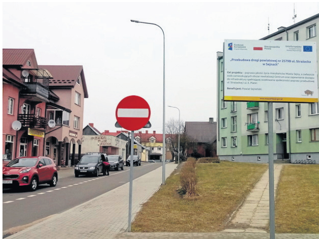
Ulica Emilii Plater w Sejnach. Została wyremontowana dzięki oszczędnościom, które udało się osiągnąć, realizując przebudowę ul. Strażackiej w Sejnach. Inwestycja otrzymała bowiem 95 proc. dofinansowania z RPO WP 2014-2020.