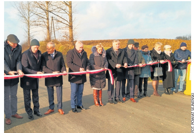
Droga powiatowa Puńsk - Wojciuliszki - Budzisko. Nową nawierzchnię zyskał odcinek o długości 0,95 km. Inwestycja kosztowała ponad 681,90 tys. zł, ale 99,7 proc. stanowiło dofinansowanie z Urzędu Marszałkowskiego Województwa Podlaskiego oraz gminy Puńsk.