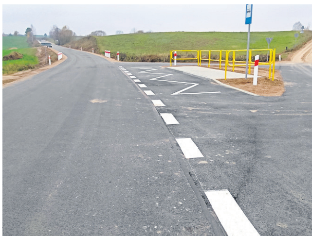
Droga Krasnopol - Gremzdel - Jegliniec - Wiatrołuża. Dzięki dofinansowaniu z Funduszu Dróg Samorządowych oraz gminy Krasnopol żwirowy odcinek o długości 2,755 km zyskał asfaltową nawierzchnię.