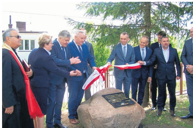
Tablicę odsłoniły osoby najbardziej zaangażowane w budowę przedsięwzięcia.

Władze powiatu sejneńskiego do tej inwestycji przymierzały się od kilku lat. W sąsiedztwie Zespołu Szkół Ogólnokształcących w Sejnach powstaje hala widowiskowo-sportowa, w której znajdą się boiska do gier zespołowych, a także siłownia, sauna, sala do fizykoterapii i rehabilitacji, sportów walki, gimnastyki korekcyjnej oraz sala do baletu.