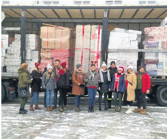
Grudzień 2021 r. 26 rodzin z powiatu sejneńskiego zostało obdarowanych w ramach akcji Szlachetna Paczka.