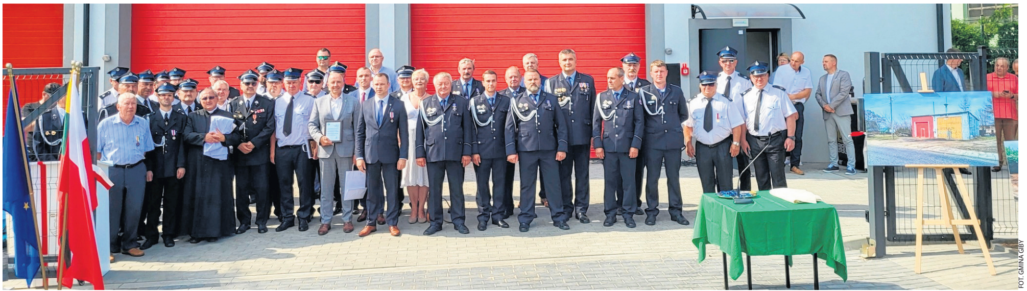
W wydarzeniu uczestniczyli przedstawiciele władz samorządowych, zaproszeni goście, strażacy oraz licznie zgromadzeni mieszkańcy.

Na ten moment mieszkańcy Gib czekali aż 30 lat. W sobotę, 23 lipca 2022 roku, oficjalnie zaprezentowano i otwarto nową, w pełni wyposażoną remizę OSP w Gibach, która odmieni życie nie tylko strażaków ochotników.