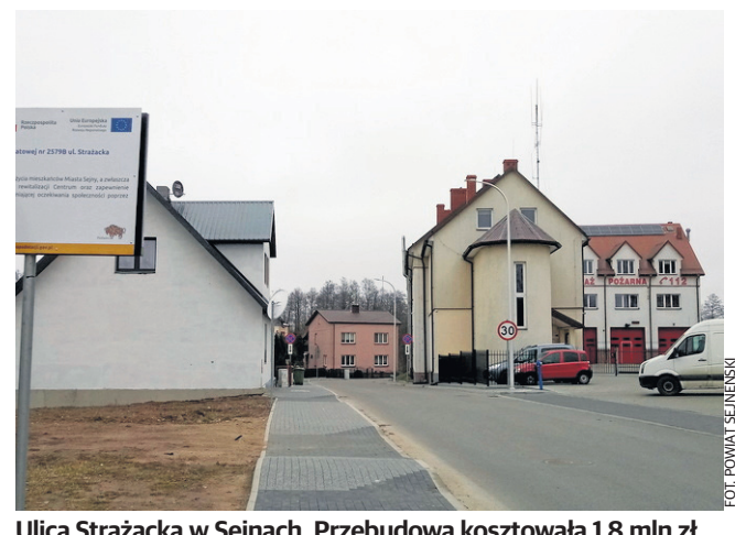
Ulica Strażacka w Sejnach. Przebudowa kosztowała 1,8 mln zł. Nie tylko wymieniono nawierzchnię, ale i przebudowano kanalizację, zbudowano kanał technologiczny, nową linię oświetleniową. Inwestycja została dofinansowana z RPO WP 2014-2020.