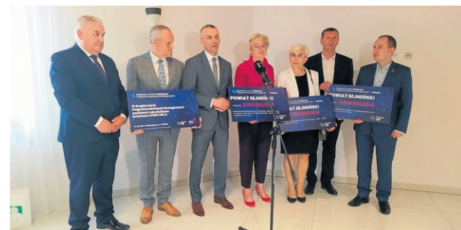
Czerwiec 2022. Symboliczny czek na dofinansowanie z II edycji Polskiego Ładu - 13 mln 860 tys. zł na 2 inwestycje drogowe i modernizację kotłowni w Sejnach oraz w Puńsku.