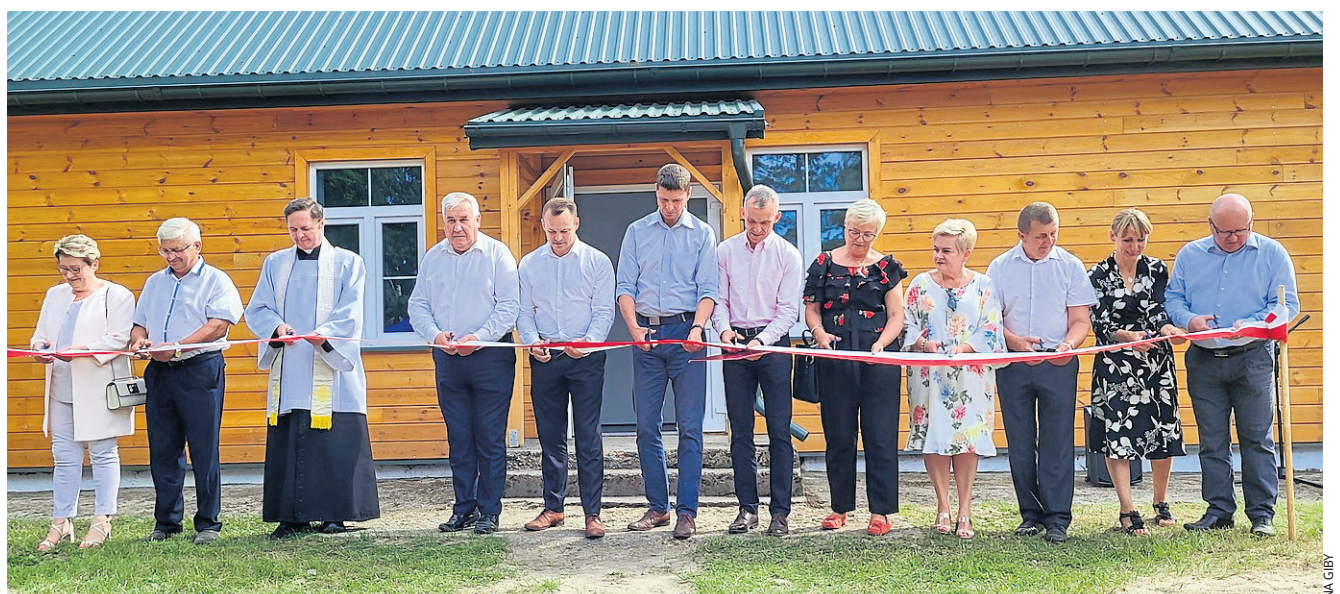
Oficjalne otwarcie świetlicy. Obiekt ma służyć mieszkańcom i ich potrzebom, ma być miejscem wydarzeń kulturalnych i warsztatów dla dzieci, gdzie pomaga się w nauce, organizuje wolny czas i rozwija zainteresowania.