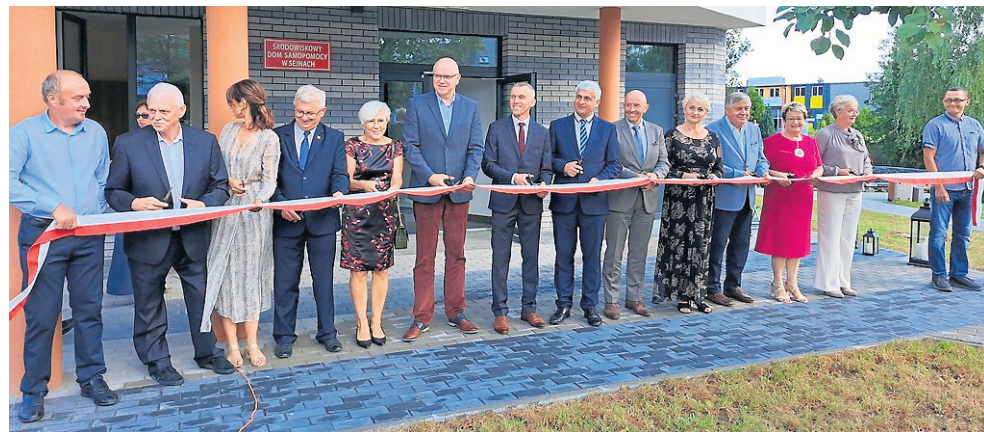
Podczas oficjalnego otwarcia nie zabrakło symbolicznego przecięcia wstęgi przez przybyłych gości.

W arsztaty Terapii Zajęciowej w Sejnach działały od 2002 r. Otwarcie nowej placówki - Środowiskowego Domu Samopomocy - zakończyło problemy lokalowe uczestników WTZ. Przez lata musieli oni zmieniać pomieszczenia.