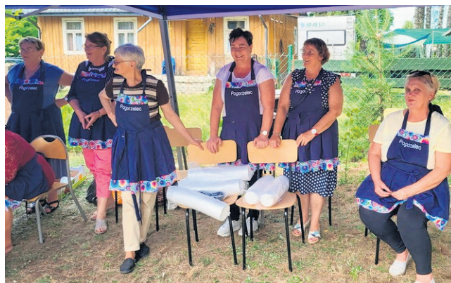
Wydarzeniom towarzyszył także piknik rodzinny, na który przybyło prawie pół tysiąca mieszkańców.

Teraz mieszkańcy cieszą się z prawie trzech kilometrów dróg. Kosztowały one trzy miliony złotych. To efekt współpracy samorządowców z gminy Giby i powiatu sejneńskiego. Pieniądze na inwestycje pochodziły ze środków obu samorządów, ale także z Rządowego Funduszu