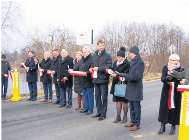
Droga powiatowa Puńsk - Szlinokiemie. Przebudowano odcinek o długości 2,6 km. Całkowita wartość inwestycji wyniosła 1,6 mln zł i aż 99 proc. stanowiły dofinansowania rządowe oraz wkład gminy Puńsk.

Nie tylko poprawiają komfort codziennego życia mieszkańców całego regionu, ale i podnoszą ich bezpieczeństwo. Podobnie jak remonty przejść dla pieszych, które zrealizowano na terenie miasta Sejny oraz gminy Krasnopol, Giby i Puńsk.