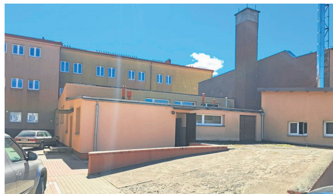
Budynek szkoły, jak i kotłownia przejdą gruntowną termomodernizację.

Kolejnym projektem, tym razem dofinansowanym z Regionalnego Programu Operacyjnego Województwa Podlaskiego na lata 2014 - 2020, było zamontowanie odnawialnych źródeł energii na obiektach użyteczności publicznej w Sejnach. Przedsięwzięcie dotyczyło aż 4 budynków. Zespół Szkół Ogólnokształcących w Sejnach zyskał instalację o mocy 39,96 kW, Powiatowy Urząd Pracy w Sejnach - instalację