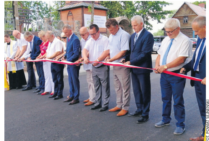
Droga Poćkuny - Berzniki na odcinku Berzniki - Folwark Berzniki. Inwestycja nie tylko obejmowała wymianę asfaltu, ale także remont przepustu na rzece Kunisianka. W ramach projektu przebudowano odcinek Berzniki - Ogrodniki wraz z remontem mostu na rzece Hołnianka. Dla zwiększenia bezpieczeństwa na poboczu drogi ustawione zostały odbłaskowe słupki.